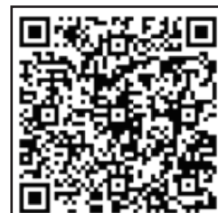
手話講座情報配信

手話学習にかかわる情報をメールでお伝えします。 ※いただいた個人情報は、講座等の情報を発信する以外に使用することはありません。